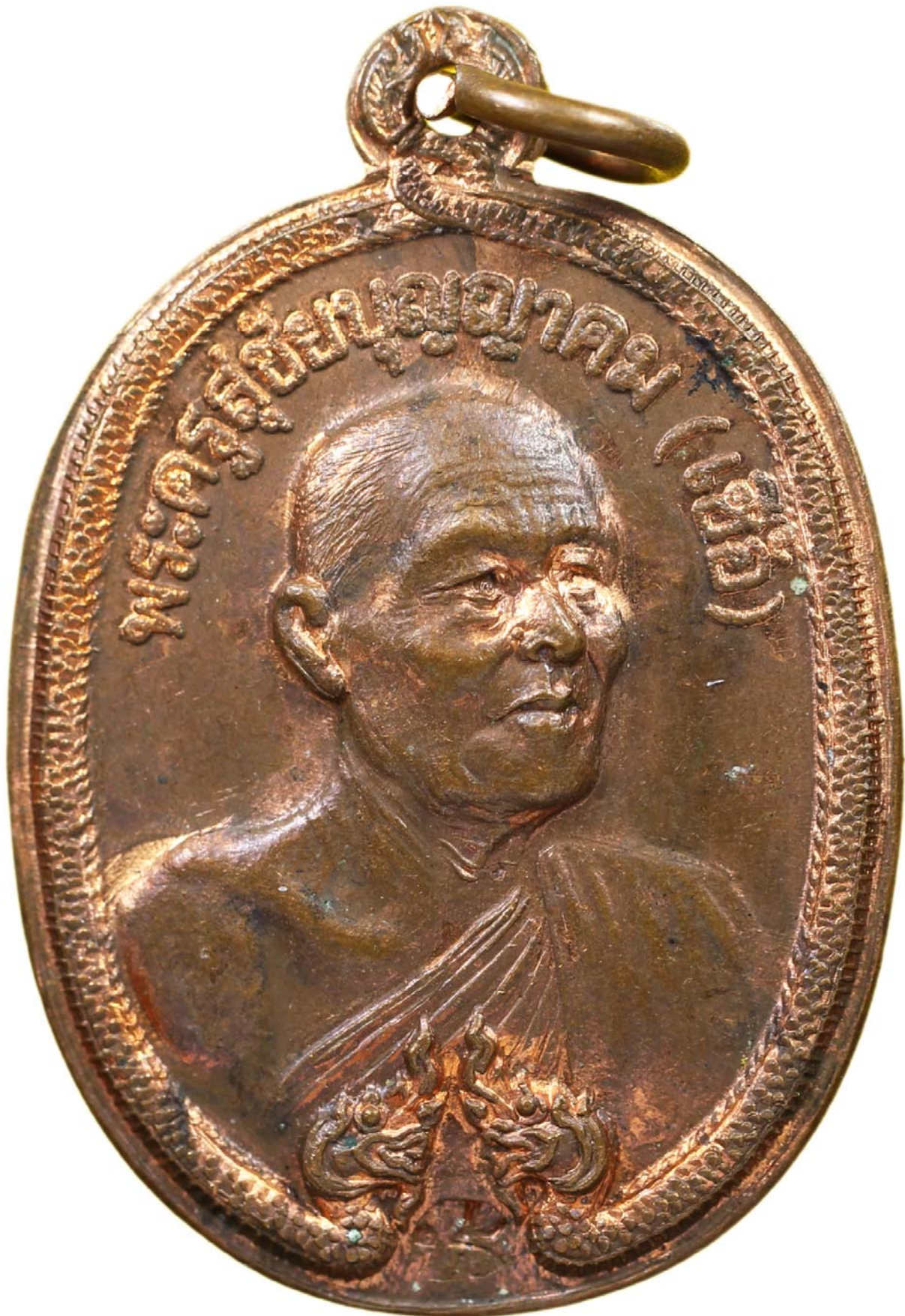
เหรียญพญานาค หลวงพ่อเชื้อ ปี พ.ศ.๒๕๑๘ เนื้อทองแดงผิวไฟ