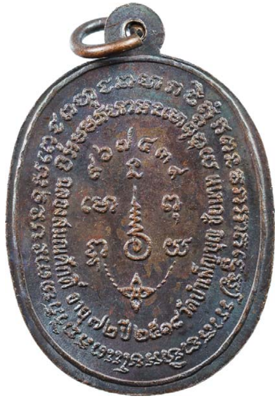
เหรียญพญานาค หลวงพ่อเชื้อ ปี พ.ศ.๒๕๑๘ เนื้อทองแดงรมมันปู