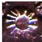
โค้ด “ดอกจันทร์”