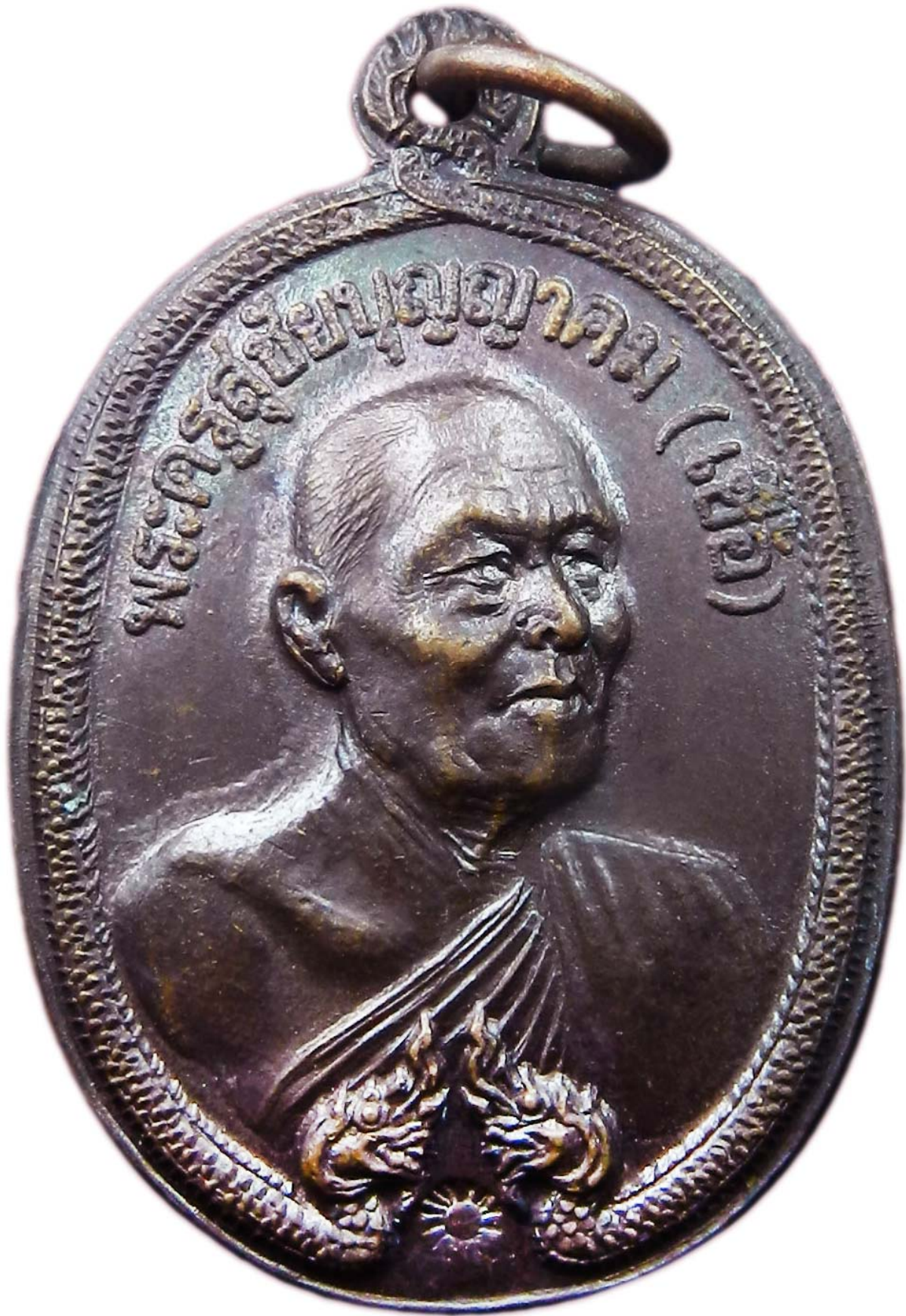
เหรียญพญานาค หลวงพ่อเชื้อ ปี พ.ศ.๒๕๑๘ เนื้อทองแดงรมมันปู โค้ตดอกจันทร์