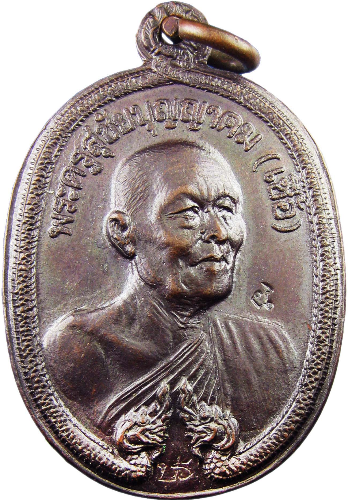
เหรียญพญานาค หลวงพ่อเชื้อ ปี พ.ศ.๒๕๑๘ เนื้อทองแดงรมมันปู โค้ด “ปร” และโค้ด “น”