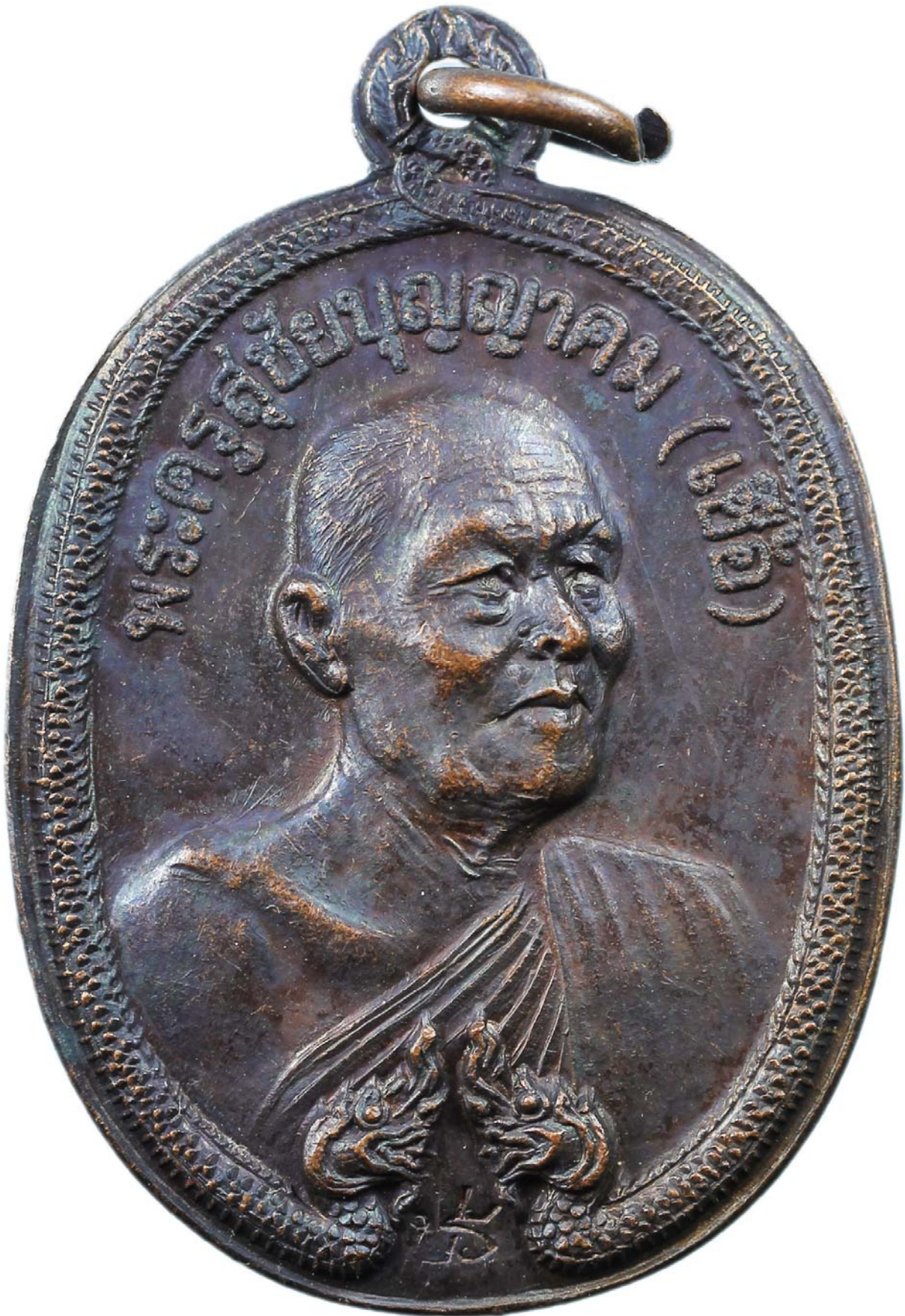
เหรียญพญานาค หลวงพ่อดี ปี พ.ศ.๒๕๑๘ เนื้อทองแดงรมมันปู