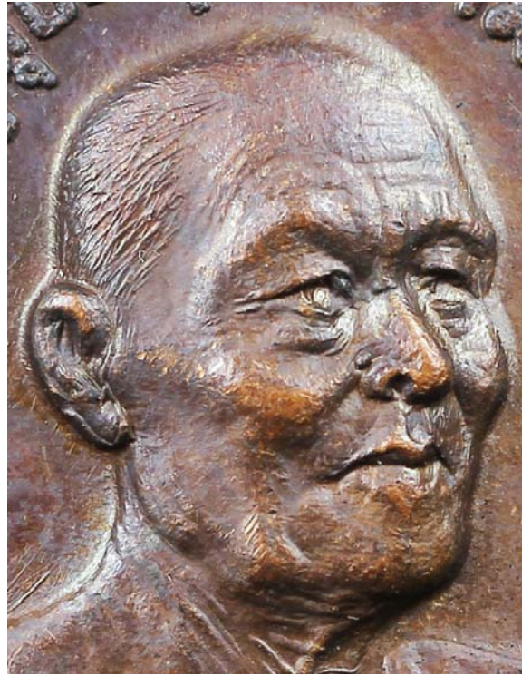
รูปถ่ายต้นแบบเหรียญพญานาค เป็นรูปถ่ายหนังข้างของหลวงพ่อ ช่างแกะแม่พิมพ์ถ่ายทอดงานออกมาได้สมจริงมาก