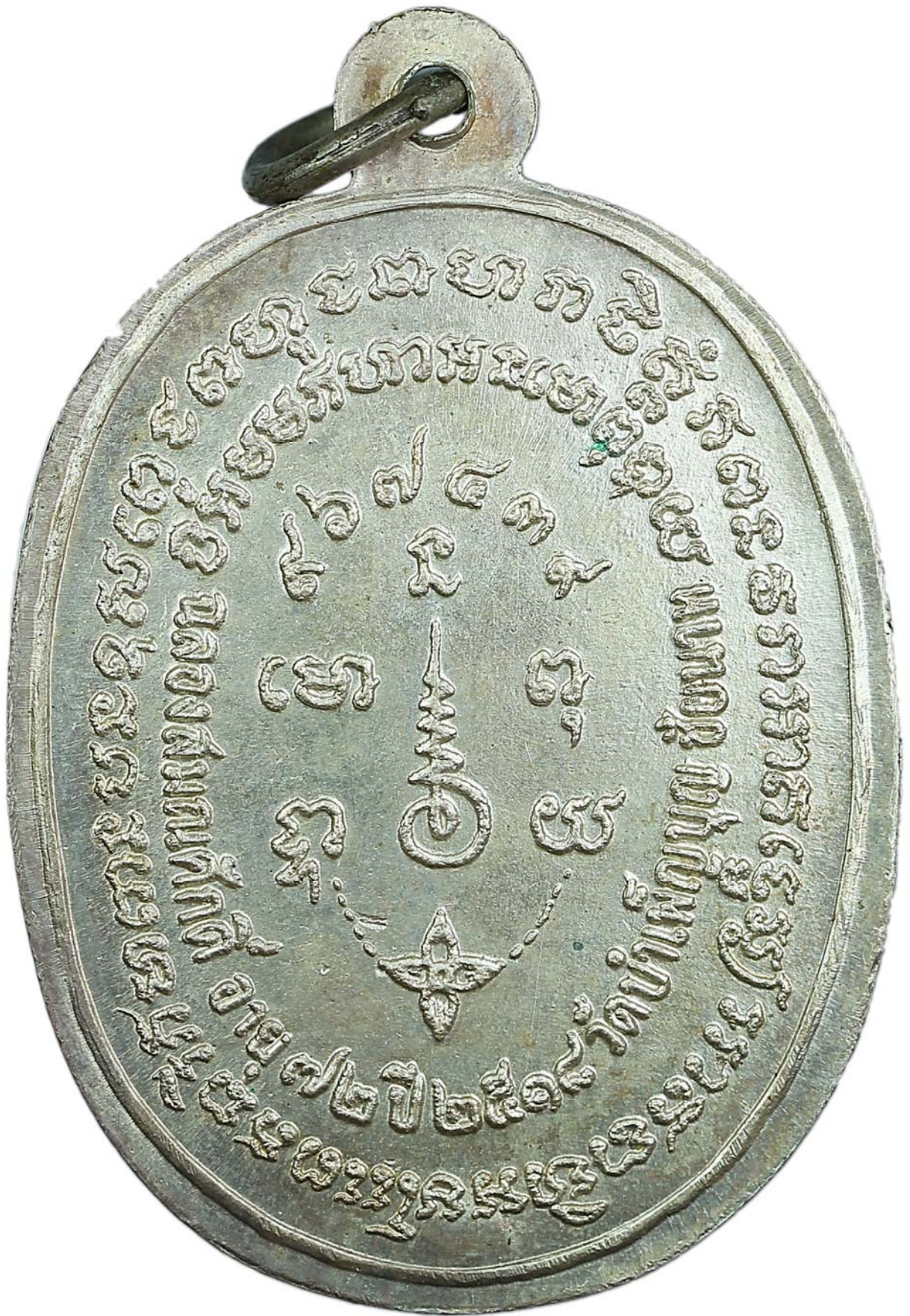
เหรียญพญานาค หลวงพ่อเชื้อ ปี พ.ศ.๒๕๑๘ เนื้อเงิน