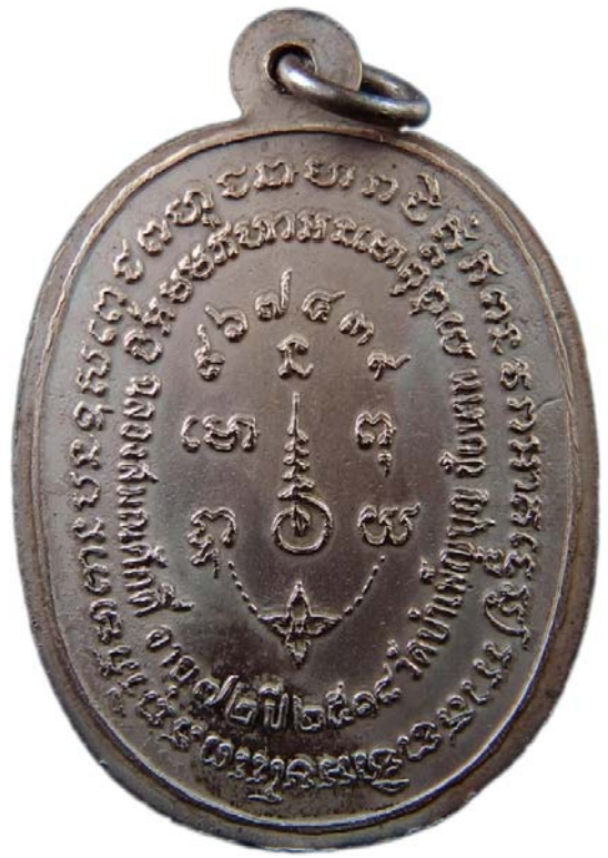
เหรียญพญานาค หลวงพ่อเชื้อ ปี พ.ศ.๒๕๑๘ เนื้อนวะโลหะ