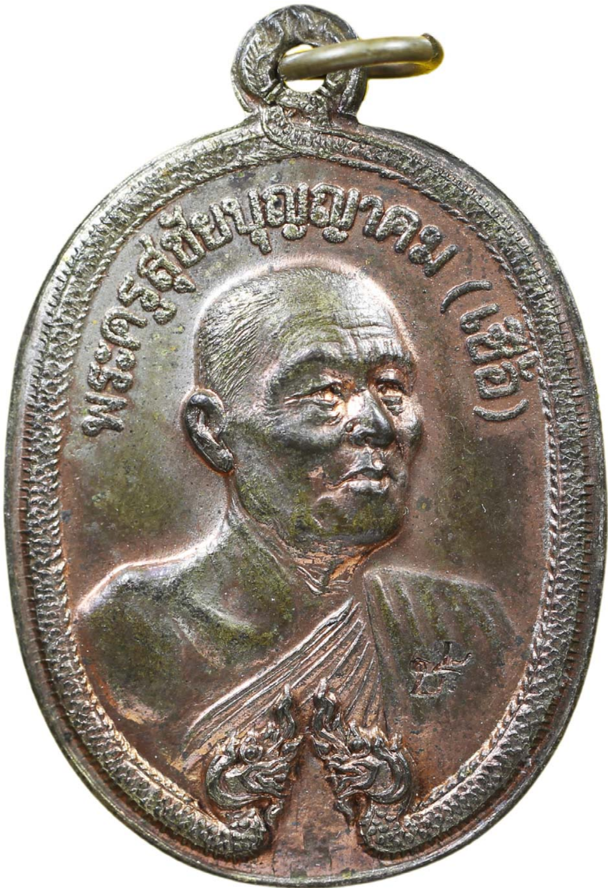
เหรียญพญานาค หลวงพ่อเชื้อ ปี พ.ศ.๒๕๑๘ เนื้อนวะโลหะ