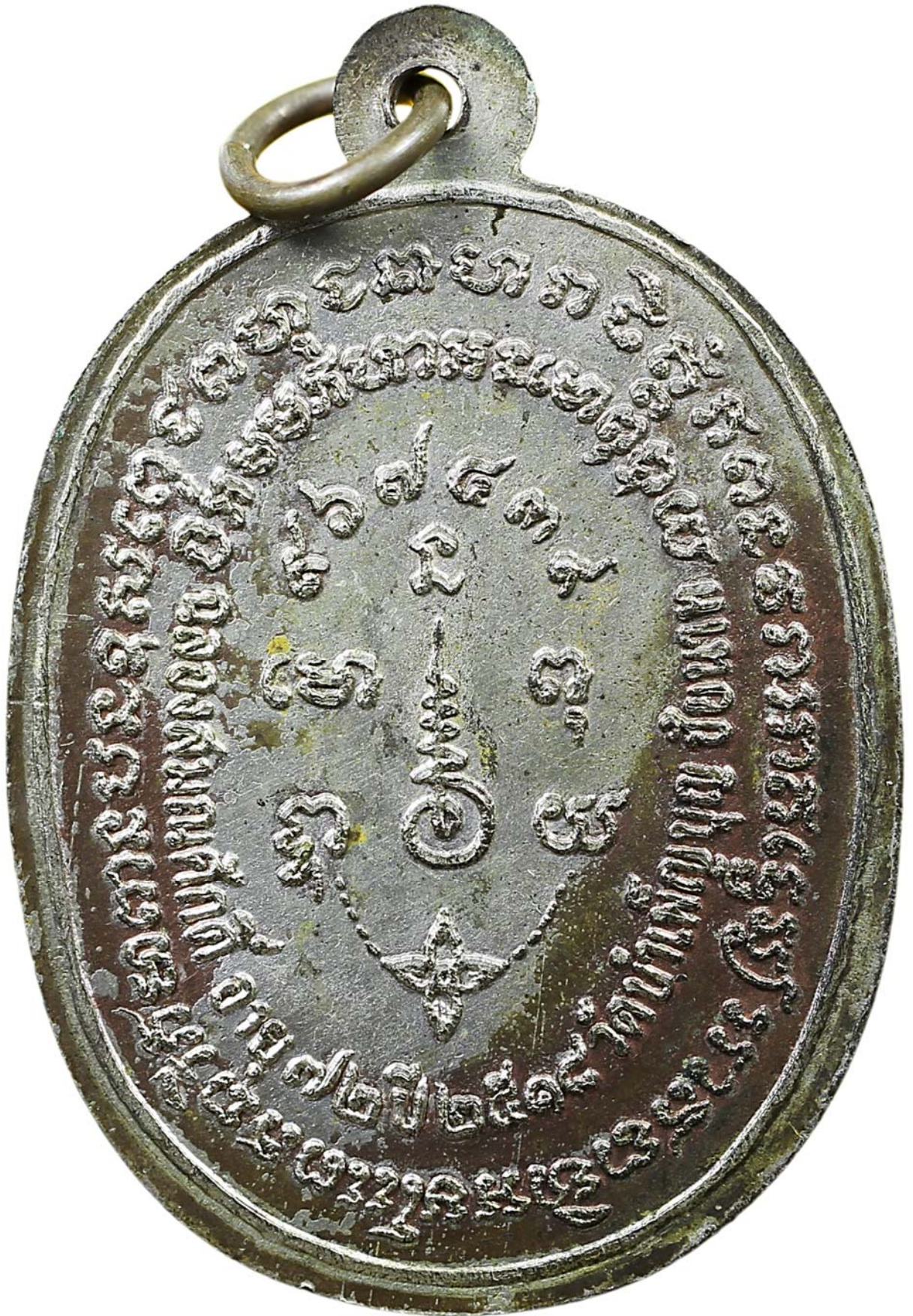
เหรียญพญานาค หลวงพ่อเชื้อ ปี พ.ศ.๒๕๑๘ เนื้อนวะโลหะ