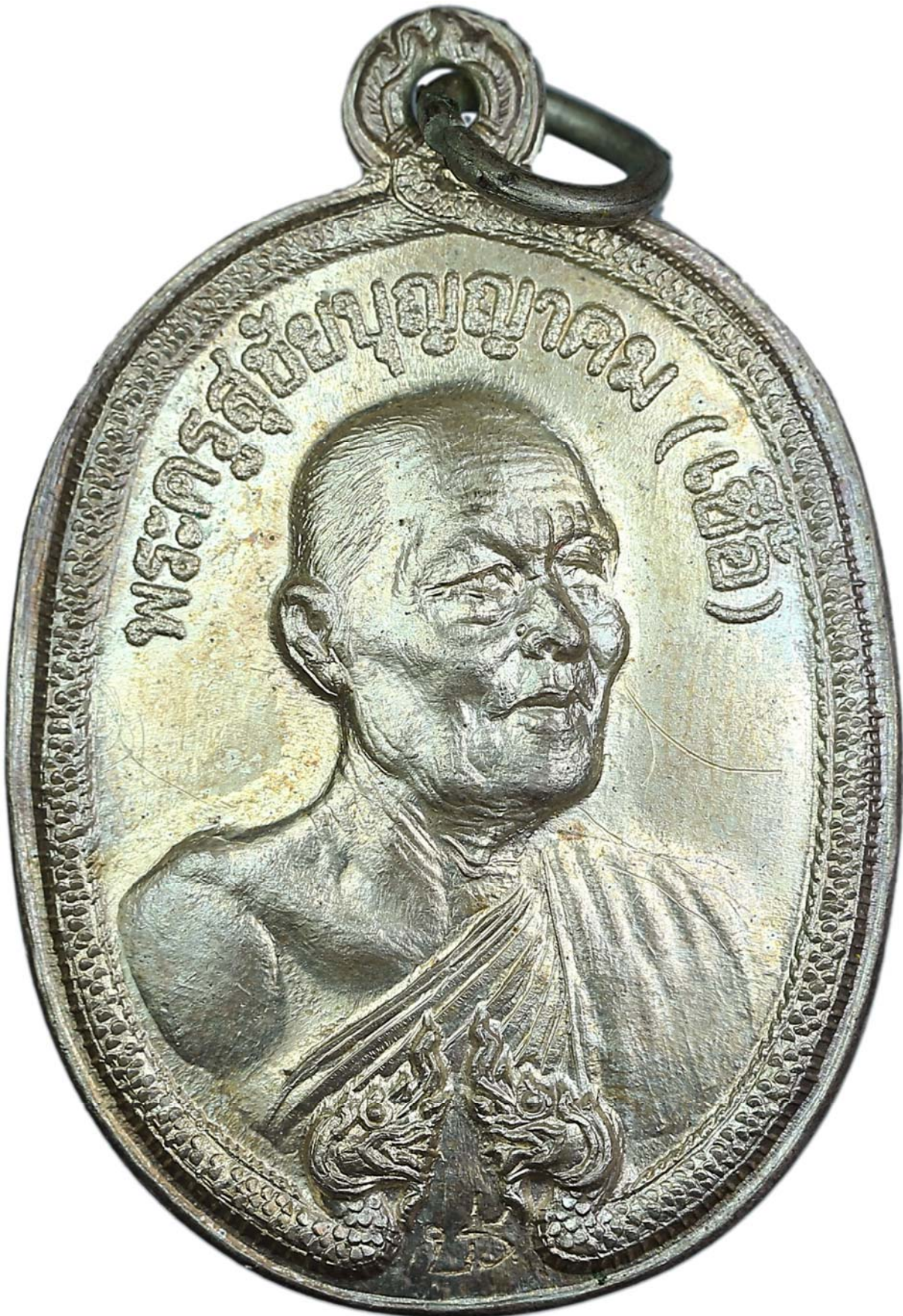
เหรียญพญานาค หลวงพ่อเชื้อ ปี พ.ศ.๒๕๑๘ เนื้อเงิน