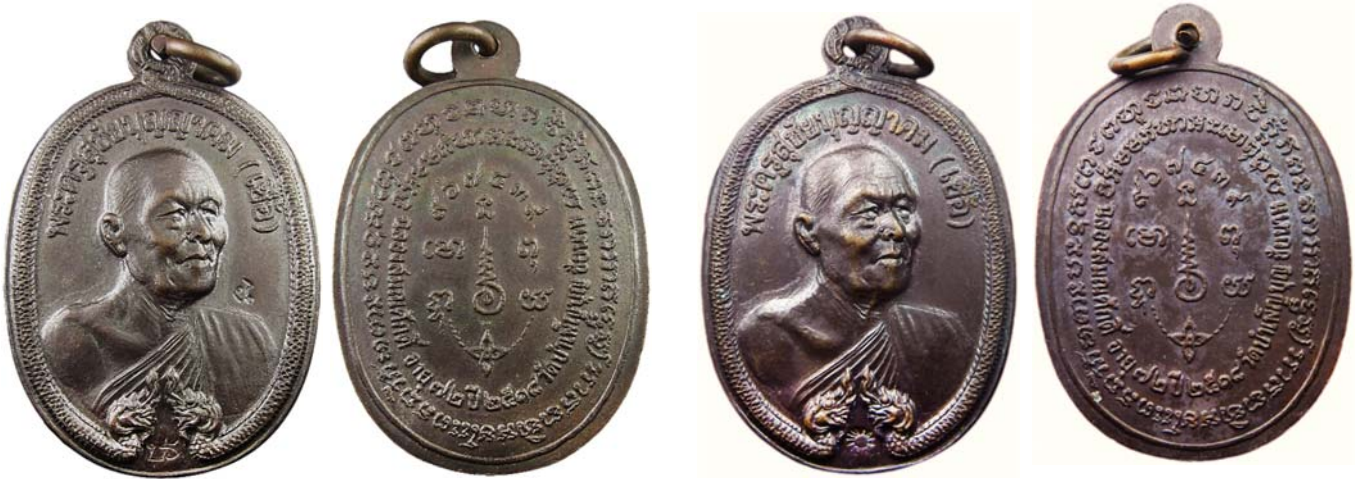
เหรียญพญานาค เนื้อทองแดงรมมันปู โค้ด “ปร” ระหว่างเศียรพญานาค และโค้ด “นะ”