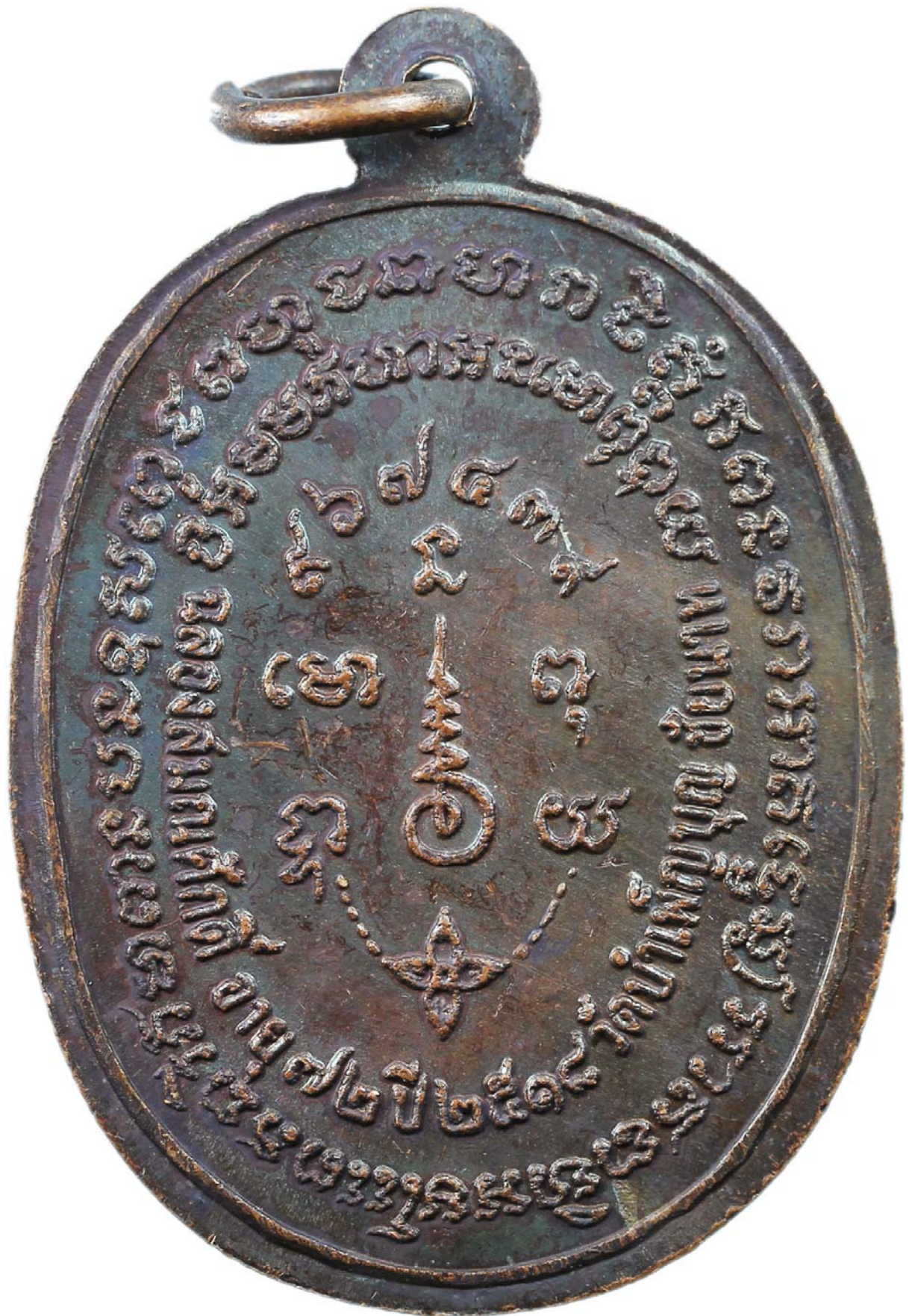
เหรียญพญานาค หลวงพ่อเชื้อ ปี พ.ศ.๒๕๑๘ เนื้อทองแดงรมมันปู