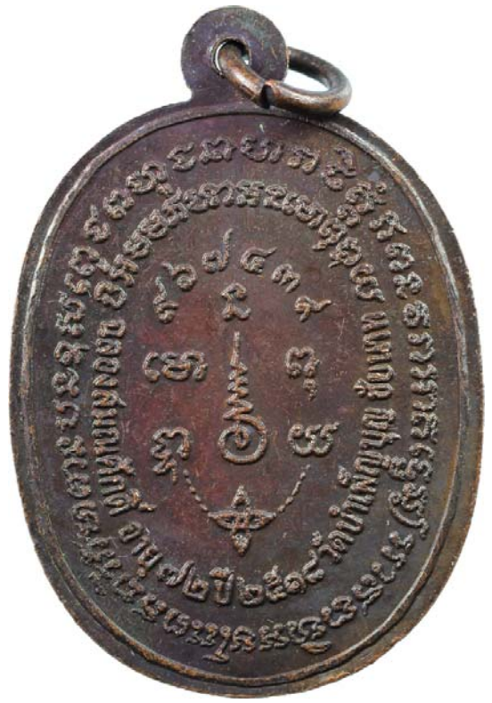
เหรียญพญานาค หลวงพ่อเชื้อ ปี พ.ศ.๒๕๑๘ เนื้อทองแดงรมมันปู