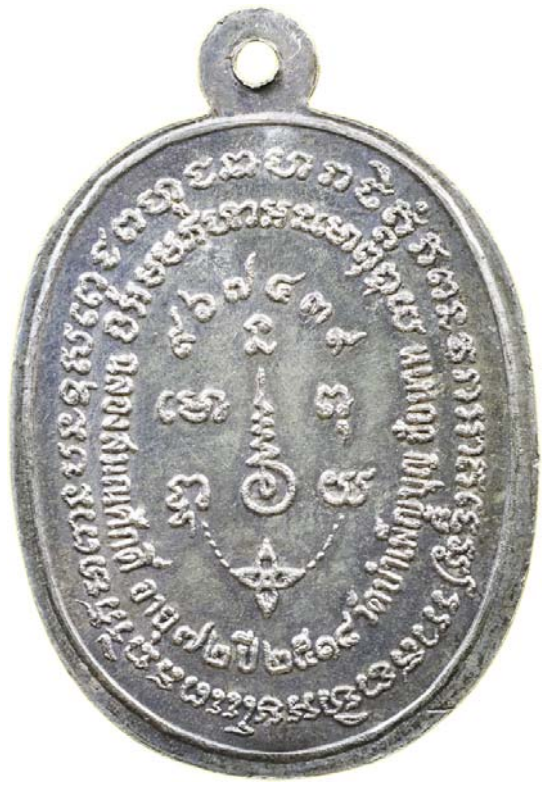
เหรียญพญานาค หลวงพ่อเขือ ปี พ.ศ.๒๕๑๘ เนื้อเงิน