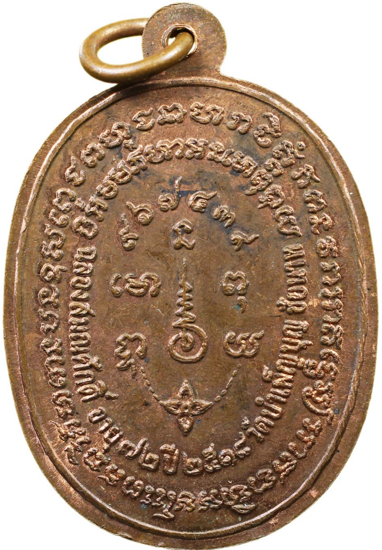
เหรียญพญานาค หลวงพ่อเชื้อ ปี พ.ศ.๒๕๑๘ เนื้อทองแดงผิวไฟ