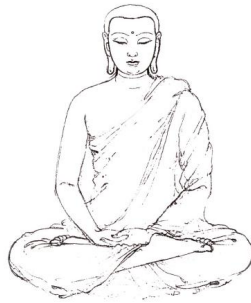
จบ มุทิตา

นิमित ๓ ภาวนา ๓ อานิสงส์ ๑๑ ก็เป็นไปเช่นเดียวกับเมตตา