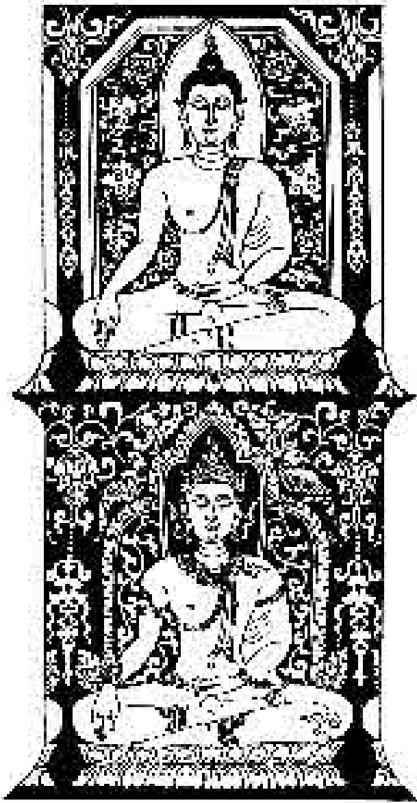
ภาพโดย พรศิลป์ รัตน์ชูเดช