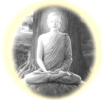
จบ หมวดสัจจะ จบ ธรรมานุปัสสนา

ภิกษุทั้งหลาย ภิกษุพิจารณาเห็นธรรมในธรรมทั้งหลาย คือ อริยสัจ ๔ อยู่ อย่างนี้แล