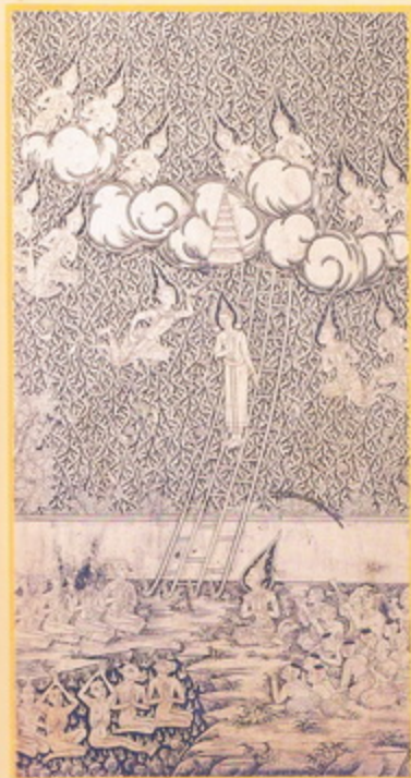
ปางเสด็จลงจากดาวดึงส์