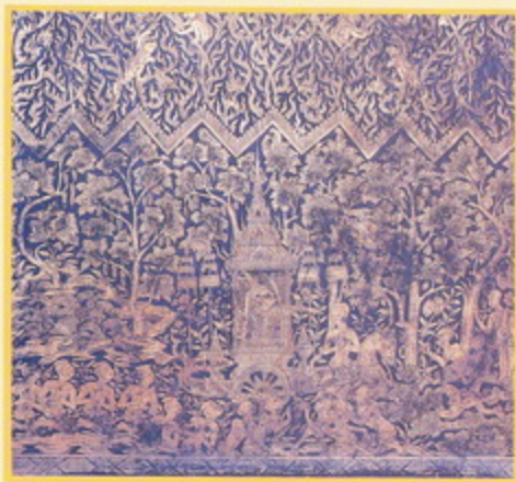
ตอนแหวกม่านแสดงนิมิตต่าง ๆ