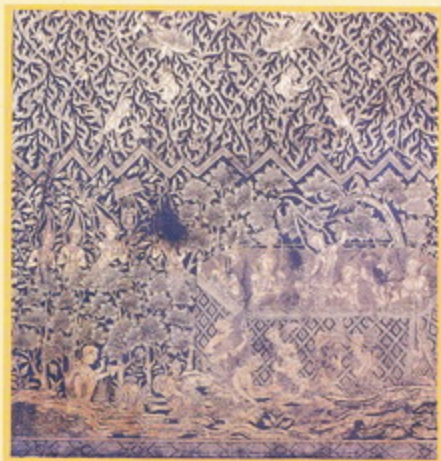
ปางประสูติ