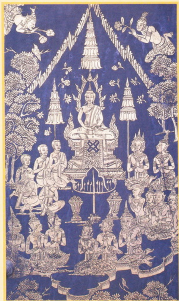
ปางปฐมเทศนา