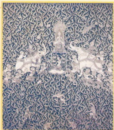
ปางมารศตย