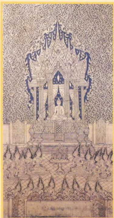
ปางโปรดพุทธมารดา