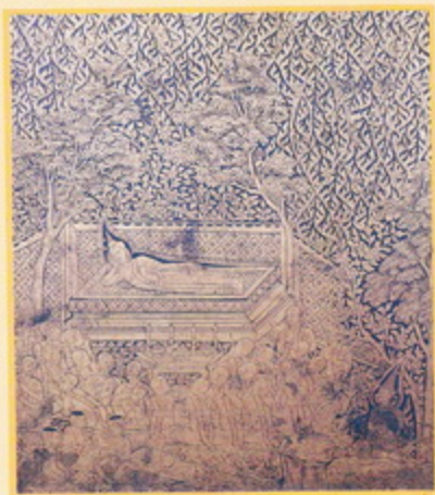
ปางเสด็จดับขันธปรินิพพาน