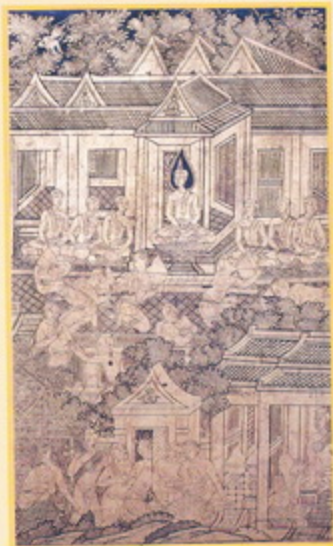
ตอนเสด็จบ้านนายจนทะ เสวยสุกรมัททวะ