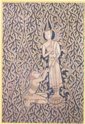
ตอนโสดยธรรมด้วยแห้วไค